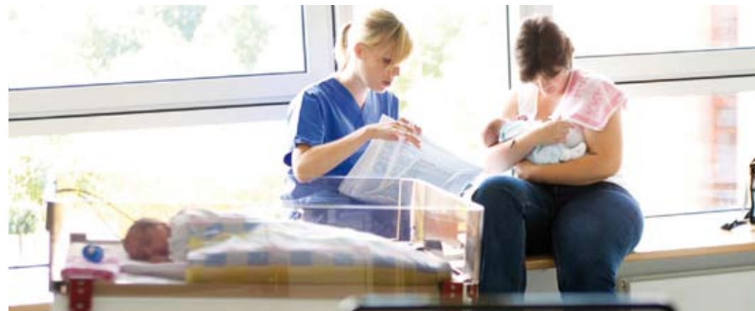
Eine Assistenzärztin geht mit der Mutter die Krankenakte des Neugeborenen durch.